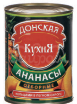
Ананасы «Донская кухня», отборные, кольцами в сиропе, 580 мл