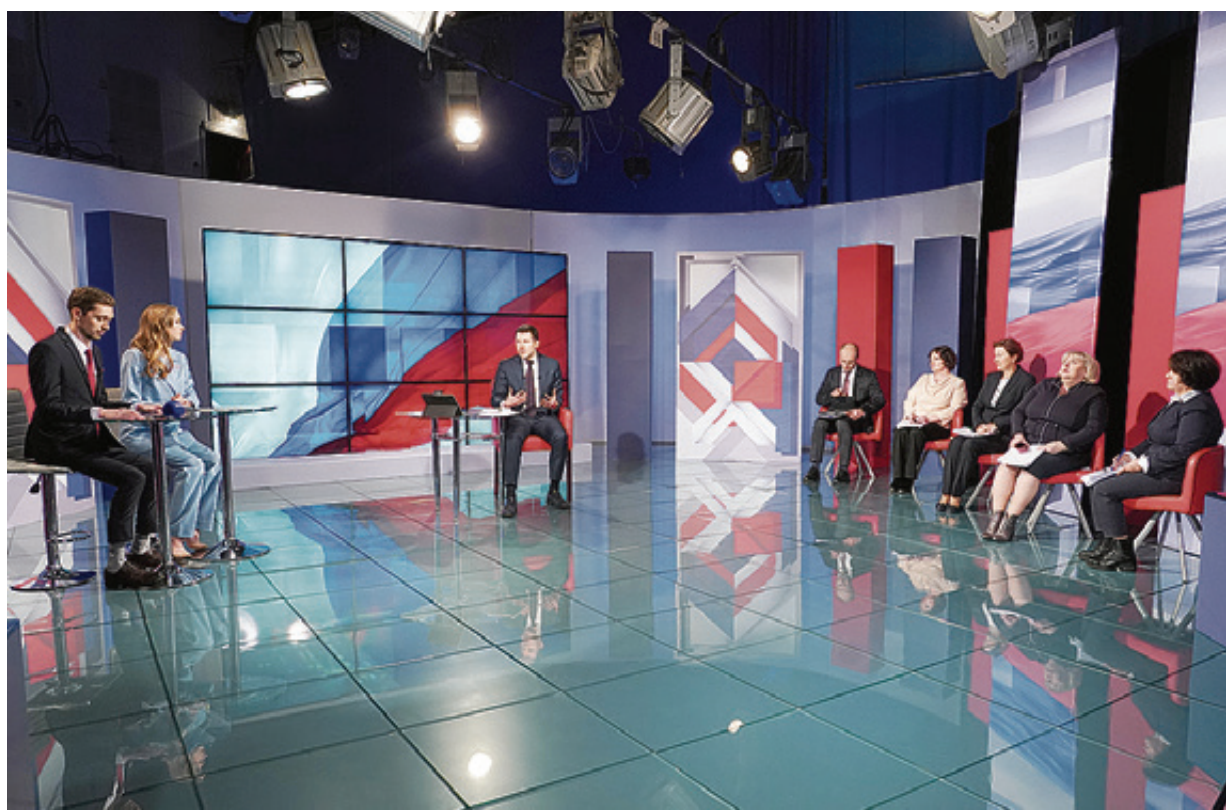
■ Глава региона рассказал о судьбе Дома Советов, поликлиники на Расковой и что нужно делать с нерадивыми подрядчиками

На первую в этом году прямую линию с губернатором обратились более 5 тысяч человек. Антон Алиханов пообещал жителям области, что будет общаться с ними чаще – раз в три месяца