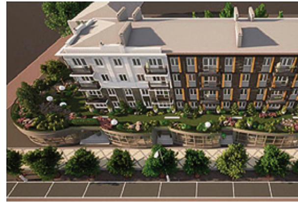
Эскиз предоставлен Фондом капремонта

Сегодня мы выходим на крышу пристройки дома на улице Зарайской. Пристройка относится к общему имуществу. Это один из основных критериев: на частных крышах проект реализовываться не будет. По техническим параметрам объект подходит, будем дальше его