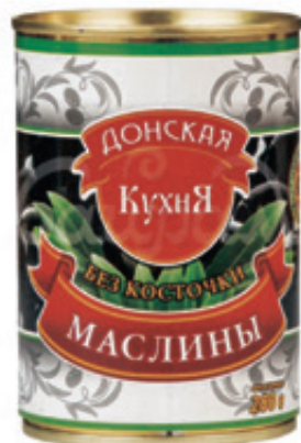
Маслины «Донская кухня», б/к, 300 г