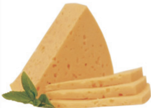
Сыр «Российский», 45%, 1 кг