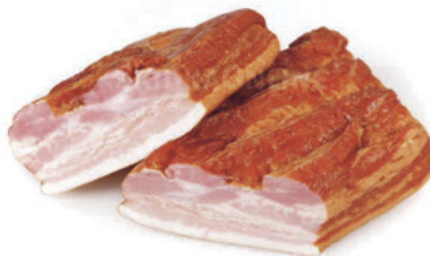
Грудинка «Сельская», к/в, 1 кг