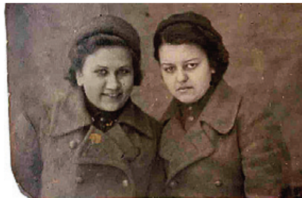
Фото из семейного архива