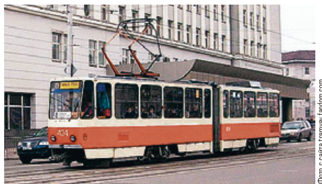
■ Та самая «четверочка»