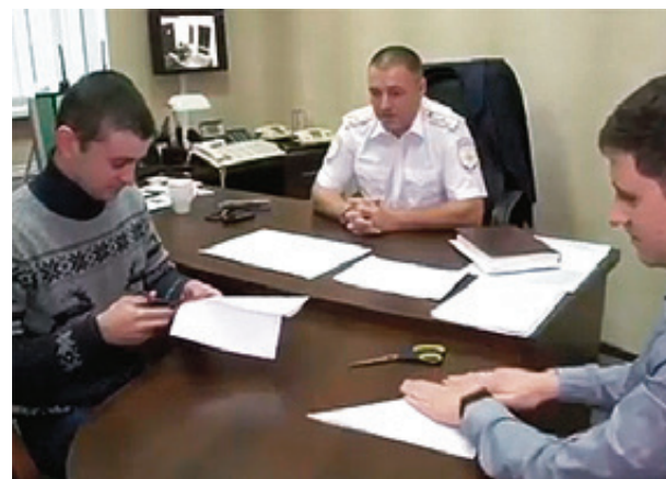
Фото из опубликованного в соцсетях видео