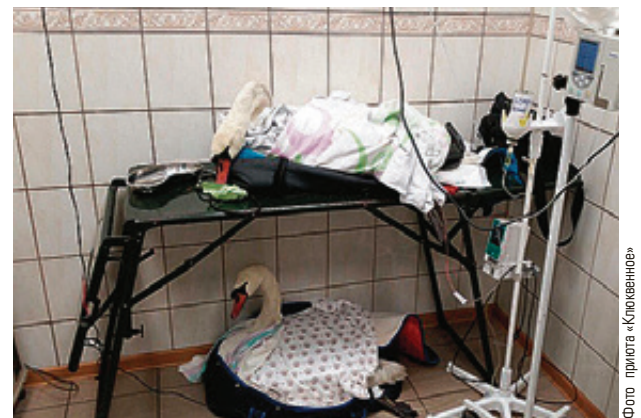
Пострадавших птиц спасают волонтеры и ветеринары

Как сообщили «ВТ» в пресс-службе администрации Калининграда, посетители примут заместители главы города и руководители структурных подразделений. Граждане смогут попасть в здание на пл. Победы, 1, обратившись в бюро пропусков в холле. При себе необходимо иметь паспорт. Личный прием будет проводиться в порядке живой очереди.