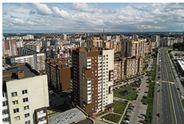
■ Новая дорога свяжет Сельму и Чкаловск

Работы на этих двух объектах уже ведутся. Если «дорогу жизни» для Чкаловска строят с 2015 года, то Дачную начали реконструировать только в ноябре. Обе трассы по-