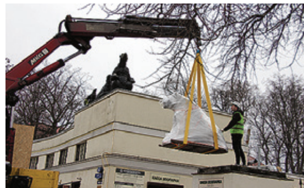
■ Демонтаж скульптур

Суд принял решение приостановить работу магазина на 70 суток.