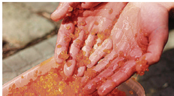
■ Роспотребнадзор нашел в магазине нарушения СанПиН