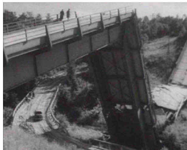
■ Чертов мост известен каждому, кто ездил по «берлинке». А таким он был в 1948 году, когда «сыграл» в фильме «Встреча на Эльбе»

Правда, в последнее время «берлинка» заметно опустела. Сперва грянула пандемия, затем - события на Украине. Как следствие, вот уже четвертый год граница почти закрыта. И в условиях нового железного занавеса «берлинка» опять становится похожей на дорогу в никуда.