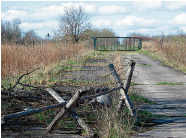
■ После войны более полувека эта дорога вела к границе, которая была в прямом смысле на замке

Зато «берлинку» сразу полюбили киношники. Автобан был идеальной натурой для «дороги где-то в Германии». Уже в первом фильме, снятом у нас