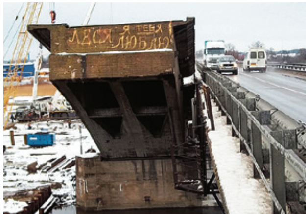
■ Забраться на задранный к небу пролет и что-нибудь написать аршинными буквами - этот опасный аттракцион остался в прошлом

Вид Берлинки действительно мог ввести в заблуждение. При взгляде на нее невольно вспоминались питерские белые ночи с разводными мостами... Но вернемся в Кёнигсберг. В ходе боев за Восточную Пруссию 29 января 1945-го советские войска оказались на подступах к Берлинскому мосту. Наши его не бомбили, надеялись воспользоваться этой переправой при штурме города. И когда немцы поняли, что важ-