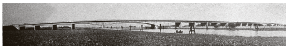
■ Таким был этот мост, когда его называли Пальмбургским и еще не взорвали

ный объект им уже не удержать, они решили его взорвать.