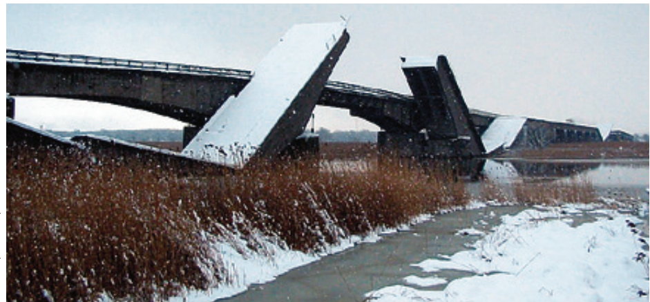
■ На протяжении десятилетий в Калининграде можно было наблюдать монументальное эхо войны