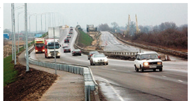
■ А так он выглядел десять лет назад, когда было открыто движение по первой очереди уже нового моста

Вторую половину нового моста открыли 7 декабря 2016-го. Кстати, почему его называют Берлинским?