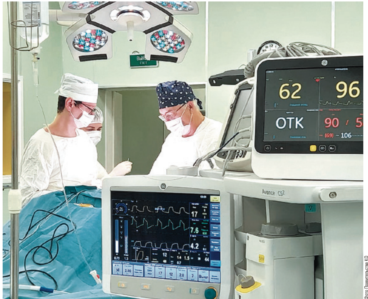
■ Операция длилась 40 минут. Пациентка сегодня чувствует себя хорошо

По словам заведомления нейрохирургии, такие кровоизлияния происходят вследствие черепно-мозго-