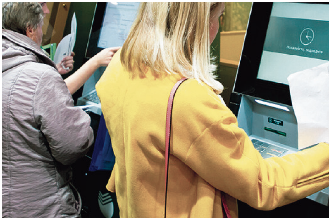
Жители Калининградской области продолжают переводить свои сбережения незнакомым людям

Не теряйте бдительности! Ни с кем не обсуждайте свои финансовые дела по телефону.