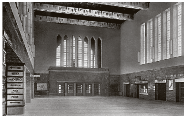
■ Кёнигсбергские интерьеры вокзала и площадь перед ним и сегодня узнаваемы, хоть уже и прошло столько лет

Вот и шутили невесело, что Северный вокзал впору перепрофилировать в тренировочную базу. Для альпинистов.