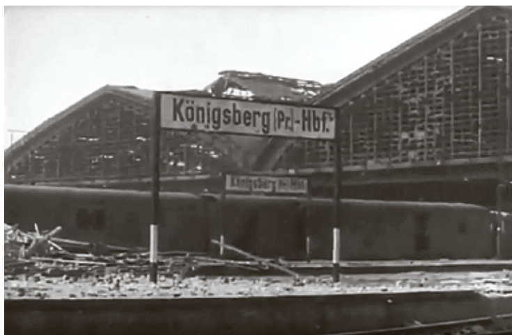
■ Главный вокзал Кёнигсберга в апреле 1945-го

29 сентября 1946-го в Калининград прибыла группа журналистов, которых ЦК ВКП(б) командировал для органи-