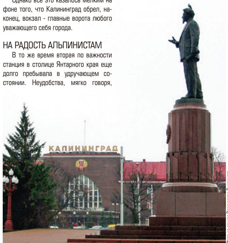
■ Здесь, у главных ворот города, в 1959 году установили памятник тому, в честь кого был переименован Кёнигсберг. Заметим, некоторое время над входом в здание было написано имя города (сейчас там снова - Южный вокзал)