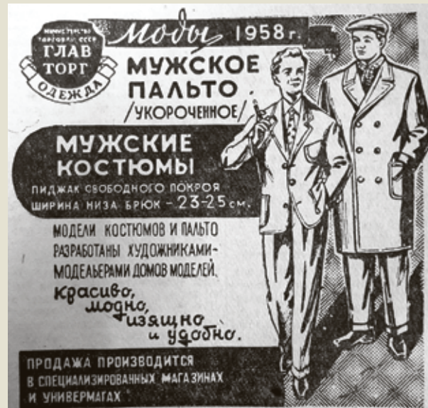
■ Если хочешь быть стильным, не превращаясь при этом в стилигу...