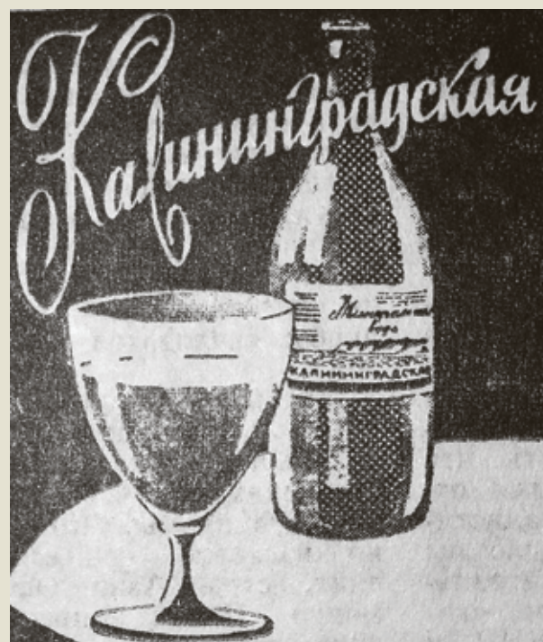
■ В 1973 году пивкомбинат в Калининграде начал выпуск фирменной минеральной воды. По своим целебным свойствам новинка не уступала лучшим аналогам