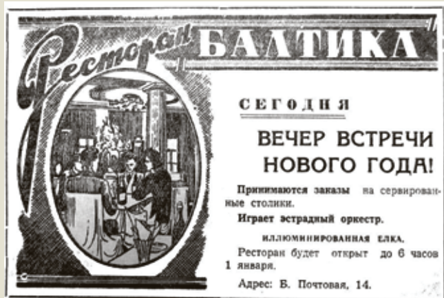
■ 31 декабря 1952-го. Большая Почтовая теперь - улица Космонавта Леонова, а ресторан «Балтика» превратился в... Стоп, это уже будет реклама

Через неделю, в следующую пятницу, вышел № 2 рекламного вестника. И в то утро его уже всю спрашивали в киосках - печатную новинку калининградцы сразу оценили по достоинству. К слову, десять лет спустя там открылась и рубрика знакомств. «Женщина 44 лет интеллигентной профессии с ж/п (жилой площадью) желает познакомиться с бывшим военным без в/п (вредных привычек) не старше 50-ти для создания семьи». И эти «непристойные» объявления первое время увлеченно читали даже те, у кого на личном фронте царил мир. Очень уж неожиданно было увидеть такое в советской газете.