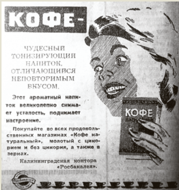
■ В начале 70-х калининградцам еще разъясняли, что же это за напиток такой - кофе