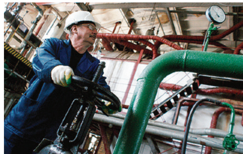
■ Мастер, не торопитесь с подключением!

Всего в школах нашего города трудятся более 2800 учителей, а возраст каждого четвертого не превышает 35 лет.