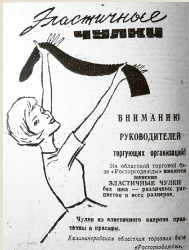
■ Иногда советская реклама вдруг позволяла себе какие-то буржуазные вольности. 1967 год