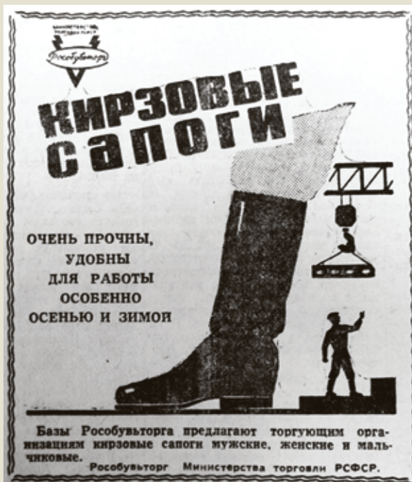
■ Хорошие сапоги, надо брать. 1962 год