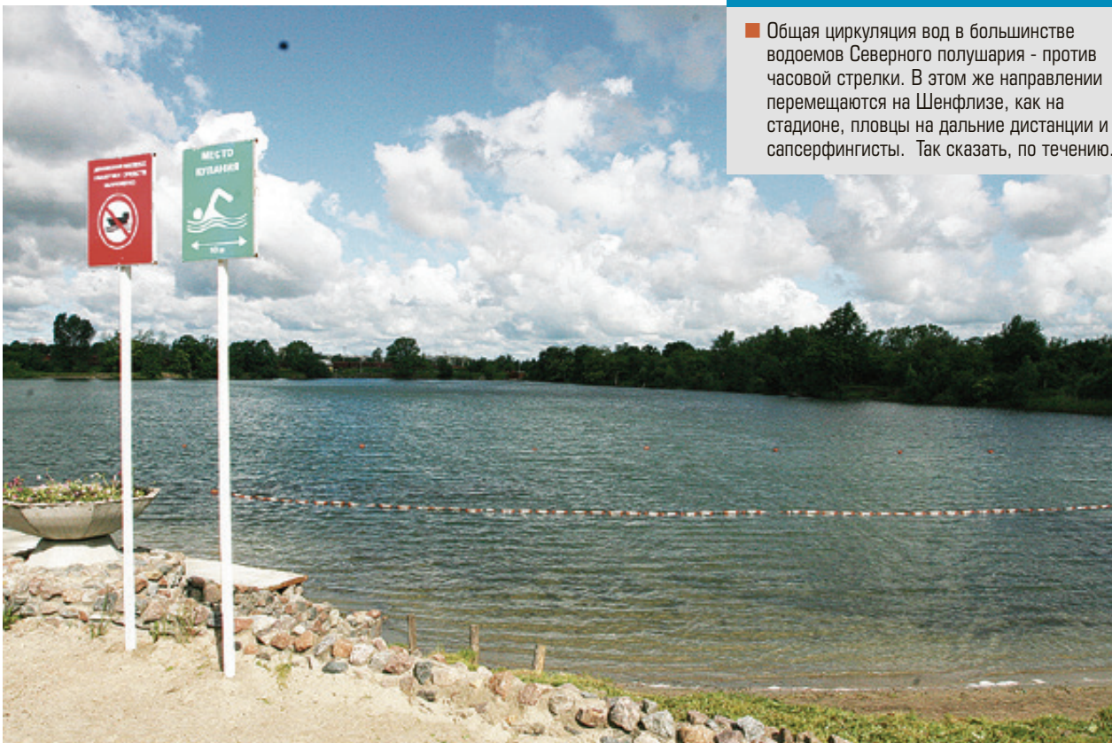
■ Летом озеро традиционно становится одним из любимых мест отдыха

Легенда о большой глубине, видимо, умерла - ямы на дне заилились, стенки их обвалились. Также уже много лет не говорят о лежащем на максимальной глубине железнодорожном вагоне. О затонувших танках и самолетах никогда не рассказывали, хотя на других водоемах такие легенды были. Несколько лет назад из озера