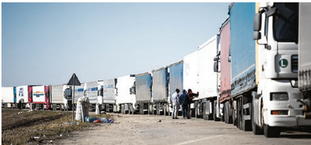
■ Когда ситуация разрешится, пока неизвестно

Как уточняет пресс-служба областной таможни, очередь на въезд в РФ отсутствует.