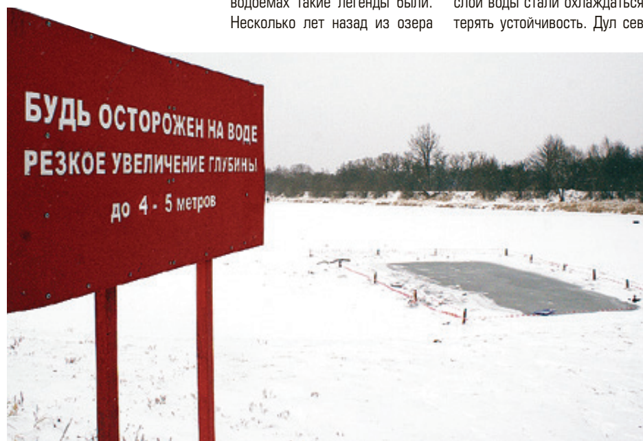
■ Зимой здесь тоже купаются! Правда, только «моржи»

Есть версия, что топоним Шенфлиз каким-то образом связан с фамилией владельца усадьбы в другом пригороде Кёнигсберга. В немецком языке имеются и другие созвучные названия и имена. Например, известный математик Артур Шенфлис, одно время работавший в Кёнигсбергском университете, специалист по симметрии и кристаллографии. Но он имел фамилию с окончанием на «с», а не на «з».