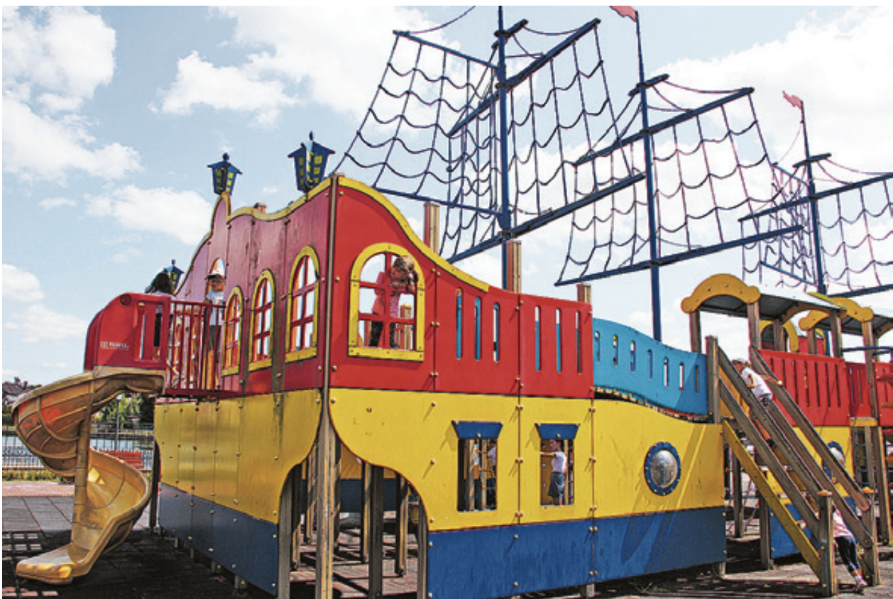
■ Та самая горка «Корабль», возле которой разгорелся конфликт

В центре Калининграда их три: на благоустроенной недавно пешеходной улице Рокоссовского, у храма на улице Невского и на Верхнем озере. В выходные дни и вечером в будние дни там столпотворение. Дети толкают друг друга на горках, отбирают силой качели, а когда получают отпор и им становится больно, плачут. И тут к ним несутся испуганные родители. Начинаются разбирательства взрослых с детьми и между собой. Ребятушки успокаиваются быстро, а вот взрослых уже не остановить. Нередко они снимают друг друга в пылу ссоры на мобильные телефоны, а затем скандал становится достоянием участников различных групп в Интернете с бурным осуждением конфликта.