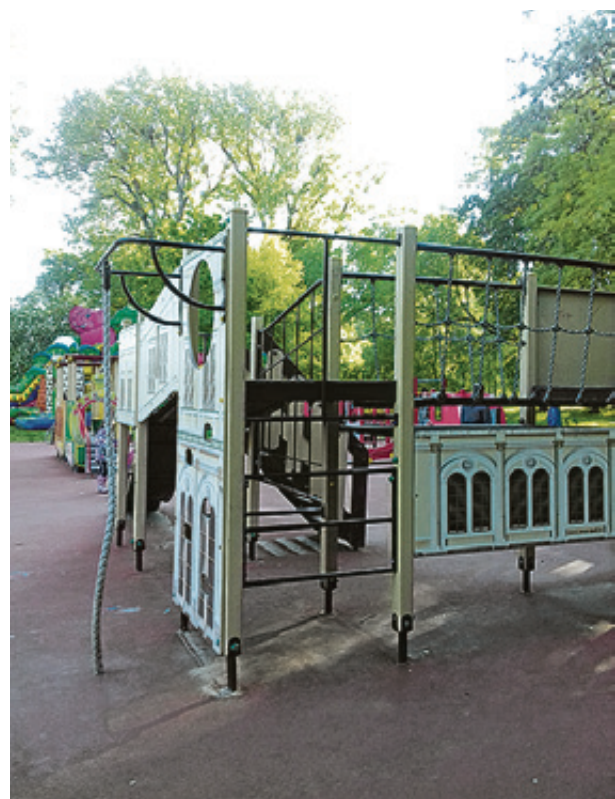
■ Эту детскую площадку признали опасной для детей

Рост населения Калининграда вызывает дефицит не только дошкольных и школьных детских учреждений. Городу не хватает безопасных, красивых, больших игровых площадок в общественных городских зонах и парках.