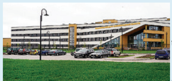
■ Строительство онкоцентра близится к завершению

Ранее сообщалось, что новое учреждение будет сдано в августе, а первых пациентов врачи центра смогут принять уже в конце этого года. Правда, если успеют пройти все необходимые процедуры лицензирования.