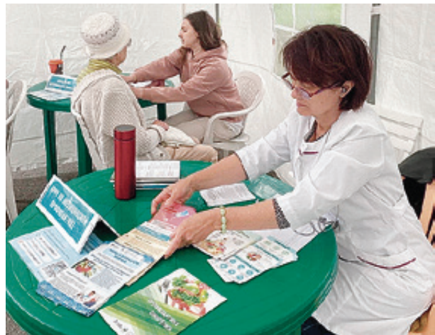
■ Во время акции можно проконсультироваться и с профильными специалистами

В ближайшую среду бригада медиков будет работать у Верхнего озера