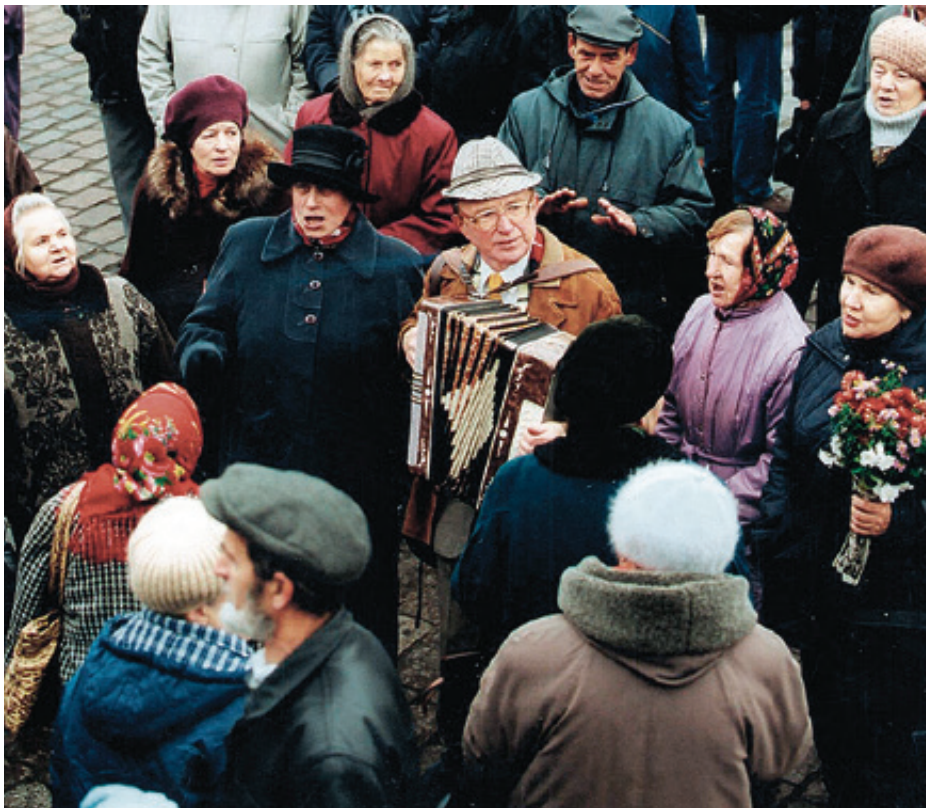
■ «В славном сорок пятом» с удовольствием пели и на праздниках, и во время застолий