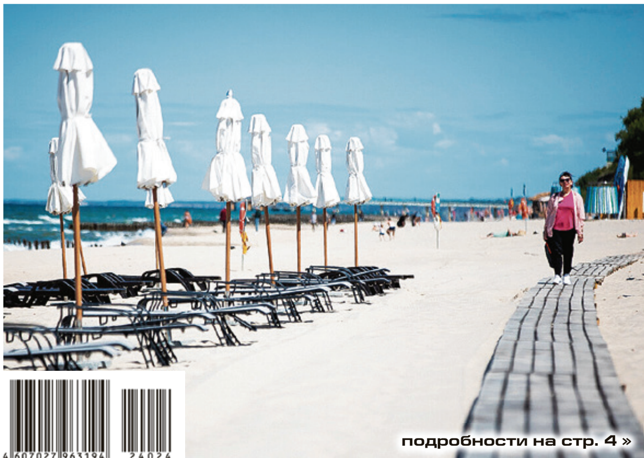
подробности на стр. 4 »