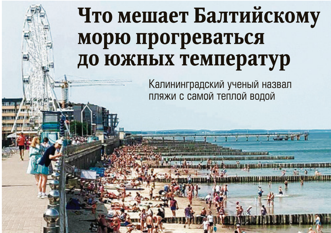
■ Пляж Зеленоградска в жаркий день

Калининградский ученый назвал пляжи с самой теплой водой