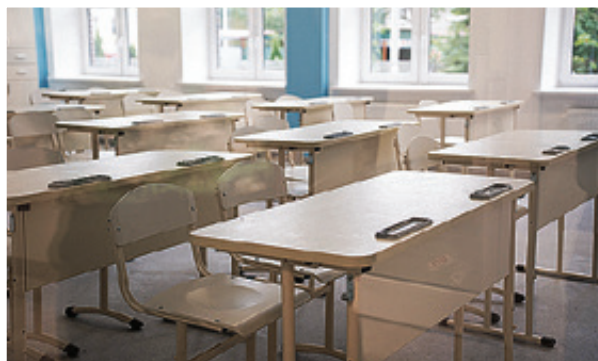
■ В классах уже расставлена мебель

- Алексей Беспрозванных проконтролировал строительство стадиона на территории школы № 48. Здесь будут обустроены беговые дорожки, пло-