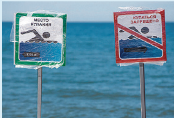
■ Спасатели убедительно просят: отдыхайте на официальных пляжах!

И главное - помните о мерах предосторожности: не плавайте в одиночку, особенно ночью, не купайтесь в шторм, не купайтесь в нетрезвом состоянии и не заходите в воду в тех местах, которые кажутся подозрительными. Выбирайте для купания оборудованные пляжи, где дежурят спасатели.