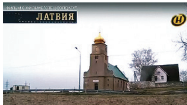
■ Если верить титрам, где-то под Ригой есть близнец бывшей кирхи, ставшей православным храмом и расположенной в поселке Новоколхозное Калининградской области

В эпизоде с виноградом на заднем плане видна полуразрушенная кирха. В Цинтене (ныне Корнево) была кирха. Правда, на сегодня от нее остался лишь торчащий над деревьями об-