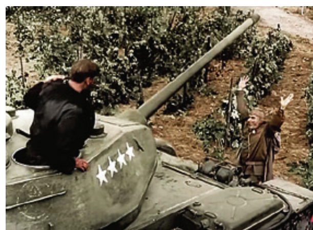
■ 10 мая 2013-го состоялась премьера колоризованной версии этого фильма. После чего для кого-то сцена в виноградаре, возможно, заиграла новыми красками

- А это уже мы находимся в пригороде латвийской столицы, - говорит там ведущий. - И в 1964 году именно вот здесь, в этой низине, снимался эпизод, когда Георгий Махарашвили увидел в Германии виноградаря.