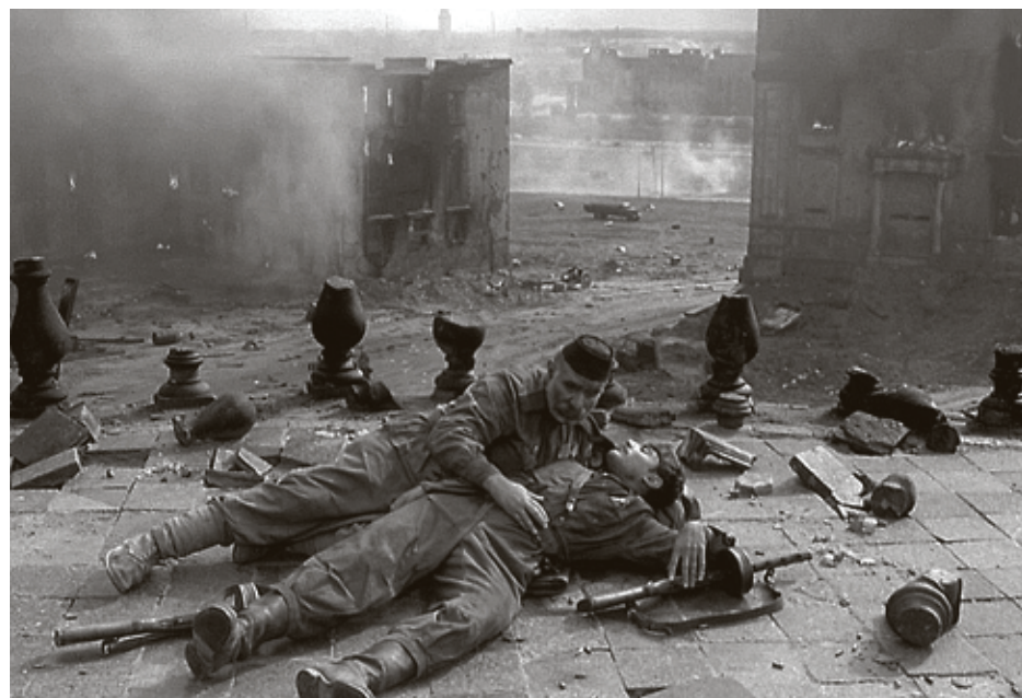
■ Последняя встреча отца и сына была снята в руинах Королевского замка