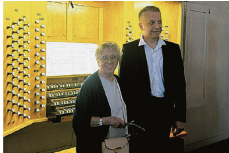
Фото Кафедрального собора

Звезда театра и кино охотно фотографировалась с поклонниками и в Зеленоградске