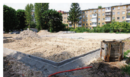
Фото Марии Калининграда