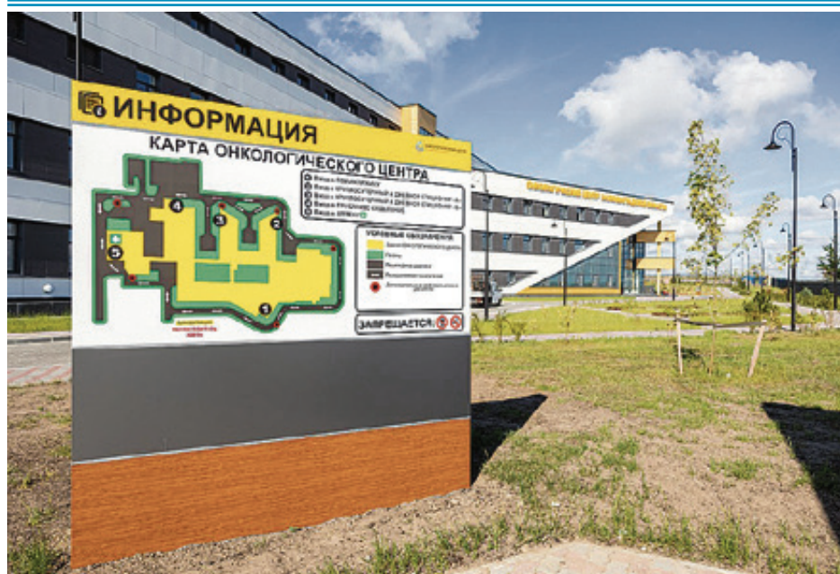
Правительство Калининградской области

■ В телеграм-канале «Онкологический центр Калининградской области» на минувшей неделе появилась еще одна подборка о том, как учреждение готовится к открытию. – Сегодня губернатор провел планерку в онкоцентре и ознакомился с ходом текущих работ, – предельно краткий комментарий сопровождал фотоматериалы. Напомним, по последней информации, открытие онкоцентра запланировано на конец августа. На этом снимке запечатлена карта территории центра. Навигации здесь уже установлено много.