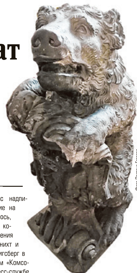
■ Этот медведь некогда охранял ратушу Кнайпхофа

экспозиции под открытым небом у Кафедрального собора. Рядом установят соответствующую информацию. Доступ к изучению найденного экспоната будет свободен.