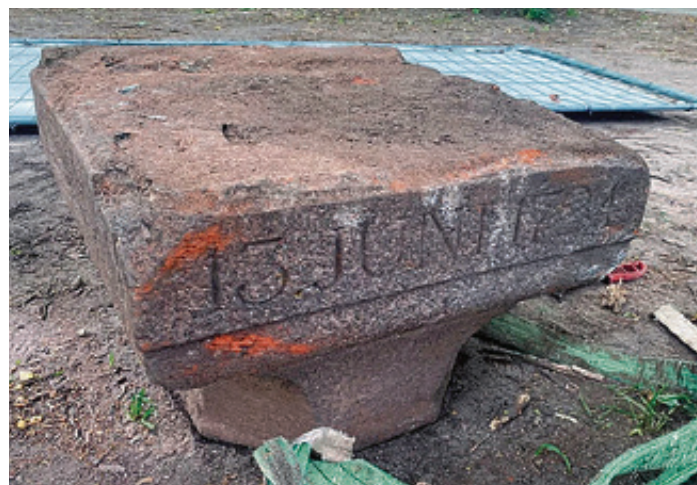
■ Дата, которую можно увидеть на камне, - 13 июня