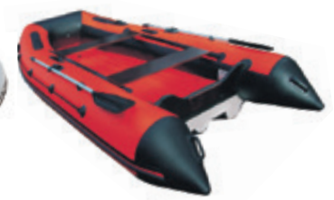
Лодка «Риф» HD «Тритон»