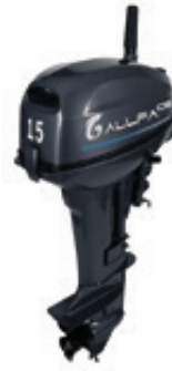
Мотор ALLFA CG T15