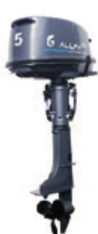
Мотор ALLFA CG T5