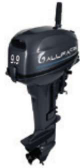
Мотор ALLFA CG T9,9