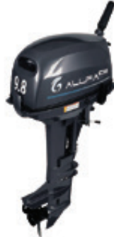
Мотор ALLFA CG T9,8