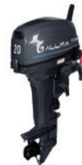
Мотор ALLFA CG T20