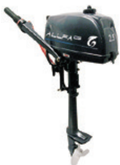
Мотор ALLFA CG T2,5