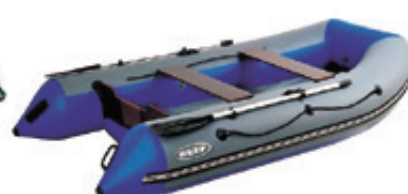
Лодки «Риф» HD