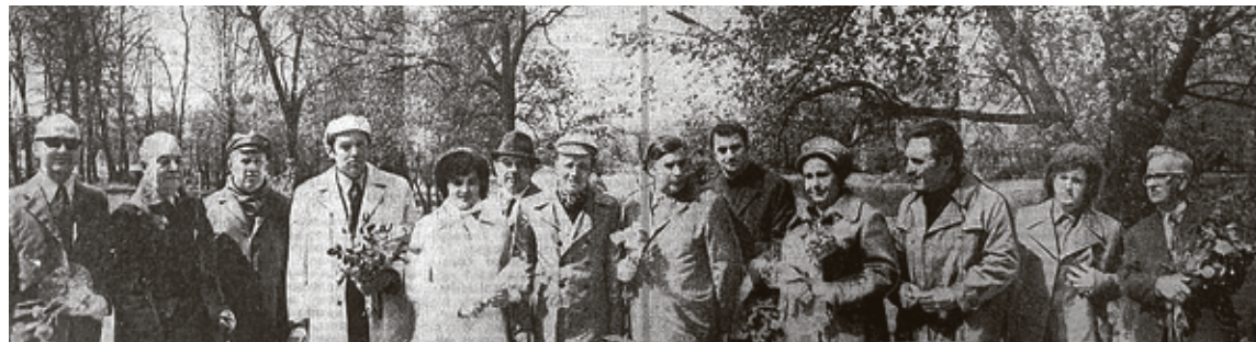
■ 14 мая 1974-го. Делегация ведущих поэтов и прозаиков СССР прибыла в Калининград

Полвека назад в Калининградской области впервые прошли Дни литературы