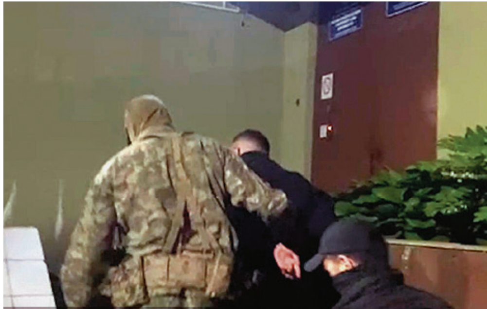
■ Задержаны трое фигурантов

По информации следствия, при помощи этой фирмы подложные