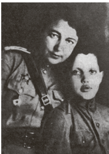
■ Будущий поэт с мамой. 1944 год.

График был напряженный. 15 мая до обеда участники Дней литературы