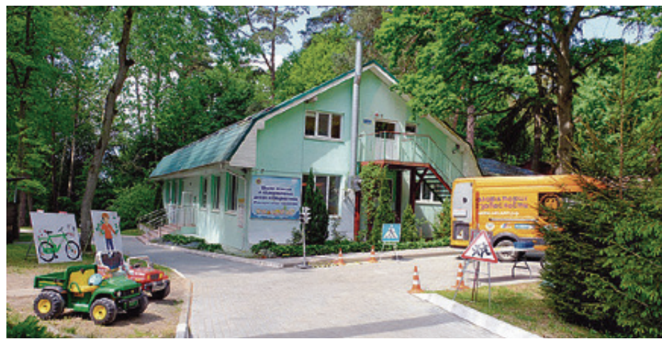
■ Центр «Чайка». Все готово к приему ребят