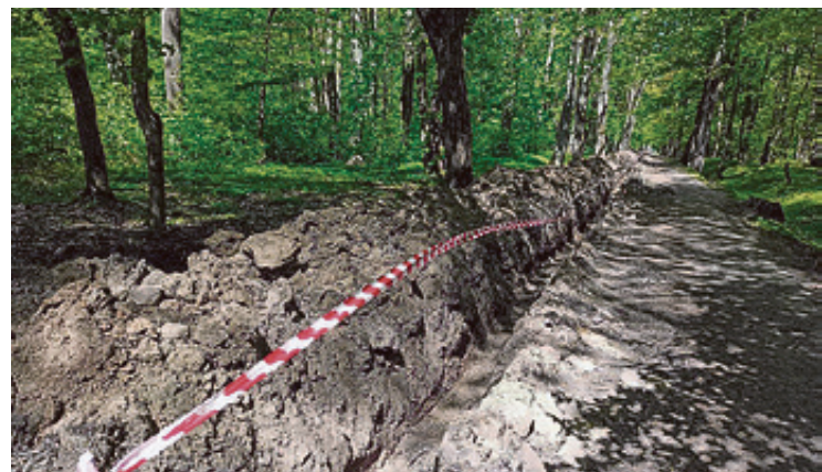
■ Приводят в порядок и главные тропы

Подписать акты выполненных работ власти рассчитывают до 22 октября.