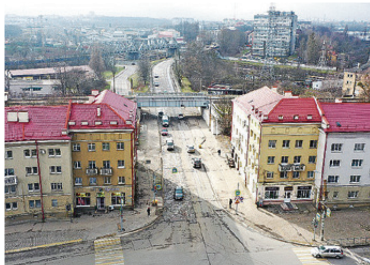
■ По мосту - не проехать, но пройти

Пользоваться им можно будет только пешеходам