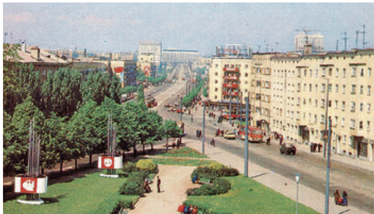
■ Часть Ленпроспекта от вокзала до Преголи (бывшая улица Маяковского) в начале 80-х

Вместе с тем специалисты понимали значимость этой улицы. И потому сами же выступили с резкими возражениями против подобного проекта,