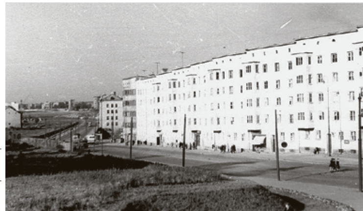
■ А так здесь было в конце 50-х

Также главный архитектор предлагал новый мост через Преголю строить не вместо двух разводных немецких (где теперь и проходит первая эстакада), а сделать его продолжением улицы Серпуховской. Эта магистраль должна была взять на себя основной транспортный поток. Ленинскому же отводилась роль «торгового центра и прогулочного бульвара», доступного только для легковых автомобилей.