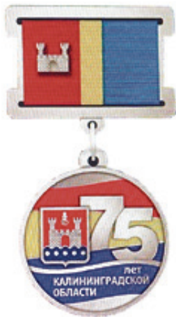
■ Юбилейная медаль к 75-летию образования Калининградской области

- К 76-летию штурма приурочена реконструкция на форте № 11. Единый выставочный