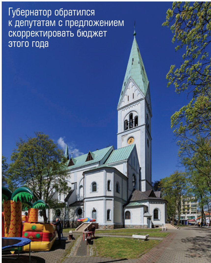
■ Преображение Театра кукол поддержит областная казна

Губернатор обратился к депутатам с предложением скорректировать бюджет этого года