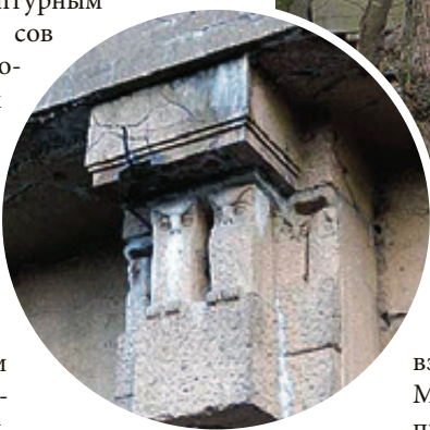
■ Сова - символ мудрости и богатства

Совушки и путти вместе с конструктивом, кронштейнами, столбами для фонарей и много чем еще