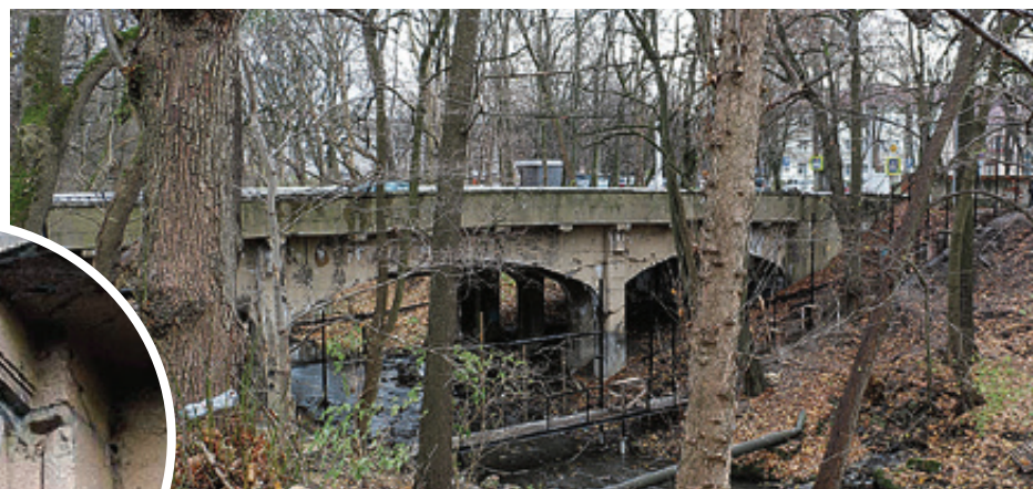
■ ...а так он выглядит сейчас