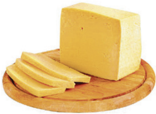
Сыр «Гауда», 45%, 1 кг