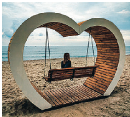
■ В этом году в Янтарном возле пляжей установят еще несколько качелей-сердец

Прошлым летом в Янтарном возле центрального пляжа установили большие качели в форме сердца. Это идеальное место с видом на Балтийское море, чтобы