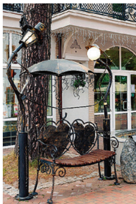
■ Скамья для влюбленных смотрится очень изящно и атмосферно

На ажурном Юбилейном мосту в Калининграде молодожены фотографируются и оставляют на память «замки любви», а ключи от них бросают в воду как символ крепости брачных уз. С моста открывается шикарный вид на Рыбную деревню и спящие летом по реке прогулочные катера. Семидесятиметровый мост был открыт в 2005 году к 750-летию города.