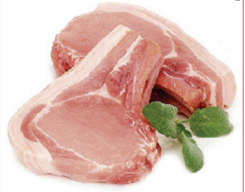
Свинина на кости (полутуши, отруб, разруб), охл.