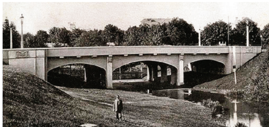
■ Так Мост влюбленных выглядел до войны...