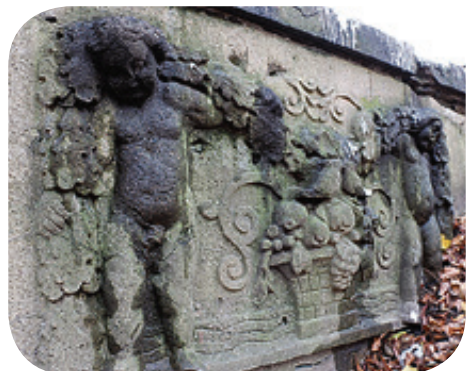
■ Путти - художественный образ маленького мальчика, сродни купидону или амур

Наследие нашей области настолько уникально, что необычное находят, казалось бы, в хорошо знакомых и привычных местах. Таких, как Мост влюбленных на улице Брамса. Это название путепровод получил в 2019 году, вернее, топонимическая комиссия вернула ему историческое название. Железобетонный трехпролетный автомобильный мост через Парковый ручей был построен в Кёнигсберге на Брамс-штрассе в 1914 году и изначально назывался Мостом влюбленных. Правда, до войны он был не таким запущенным, как сейчас. Чтобы новое имя соответствовало состоянию моста, администрация Калининграда приняла решение отремонтировать его и привести в порядок прилегающую территорию. Весной 2021 года из городского бюджета было выделено 3,7 млн рублей на проектирование ремонтных работ. Пока проект не готов.