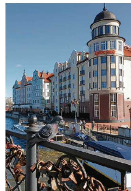
■ Юбилейный мост стоит на опорах разрушенного в 1945 году Императорского моста