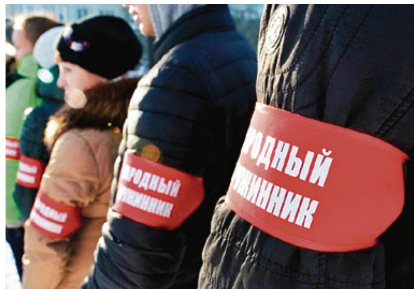
Понадобится помощь в охране объектов культурного значения

Планируется привлечь порядка 50 желающих