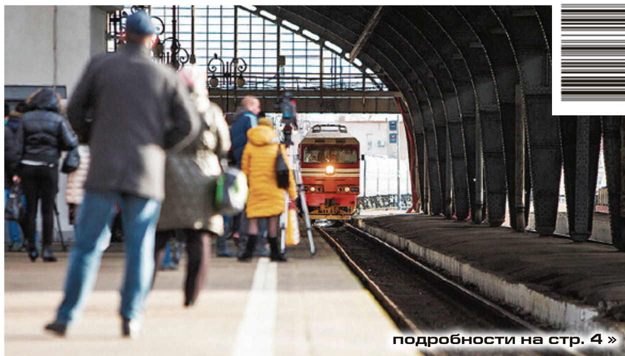
подробности на стр. 4 »