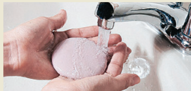
■ Чаще мойте руки!

ездки в общественном транспорте, после посещения туалета и перед едой, мытье рук с мылом позволяет снизить уровень диарейных заболеваний более чем на 40%, а респираторных инфекций - почти на 25%.