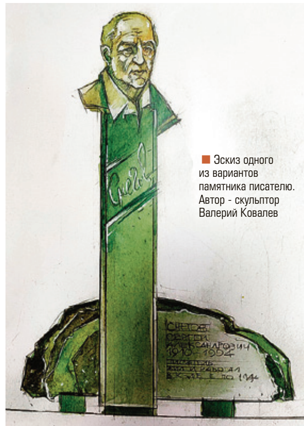
■ Эскиз одного из вариантов памятника писателю. Автор - скульптор Валерий Ковалев