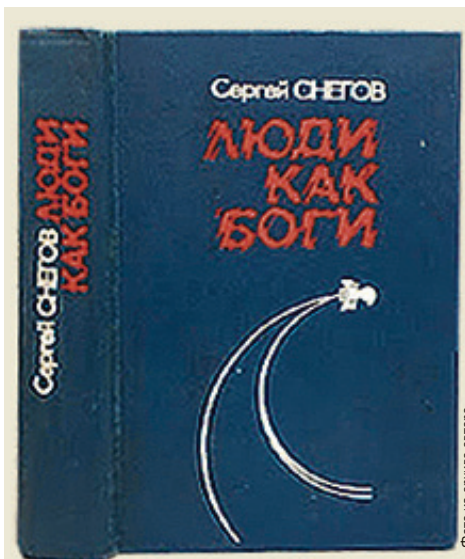
■ Самая известная книга Снегова - трилогия «Люди как боги». Она переведена на восемь языков, общий тираж на сегодня - более миллиона экземпляров

При этом он понимал, что и в философию, и в физику пути ему закрыты. И, начав в 45 лет новую жизнь, решил попытать счастья со своей третьей любовью - литературой. В 1955 году