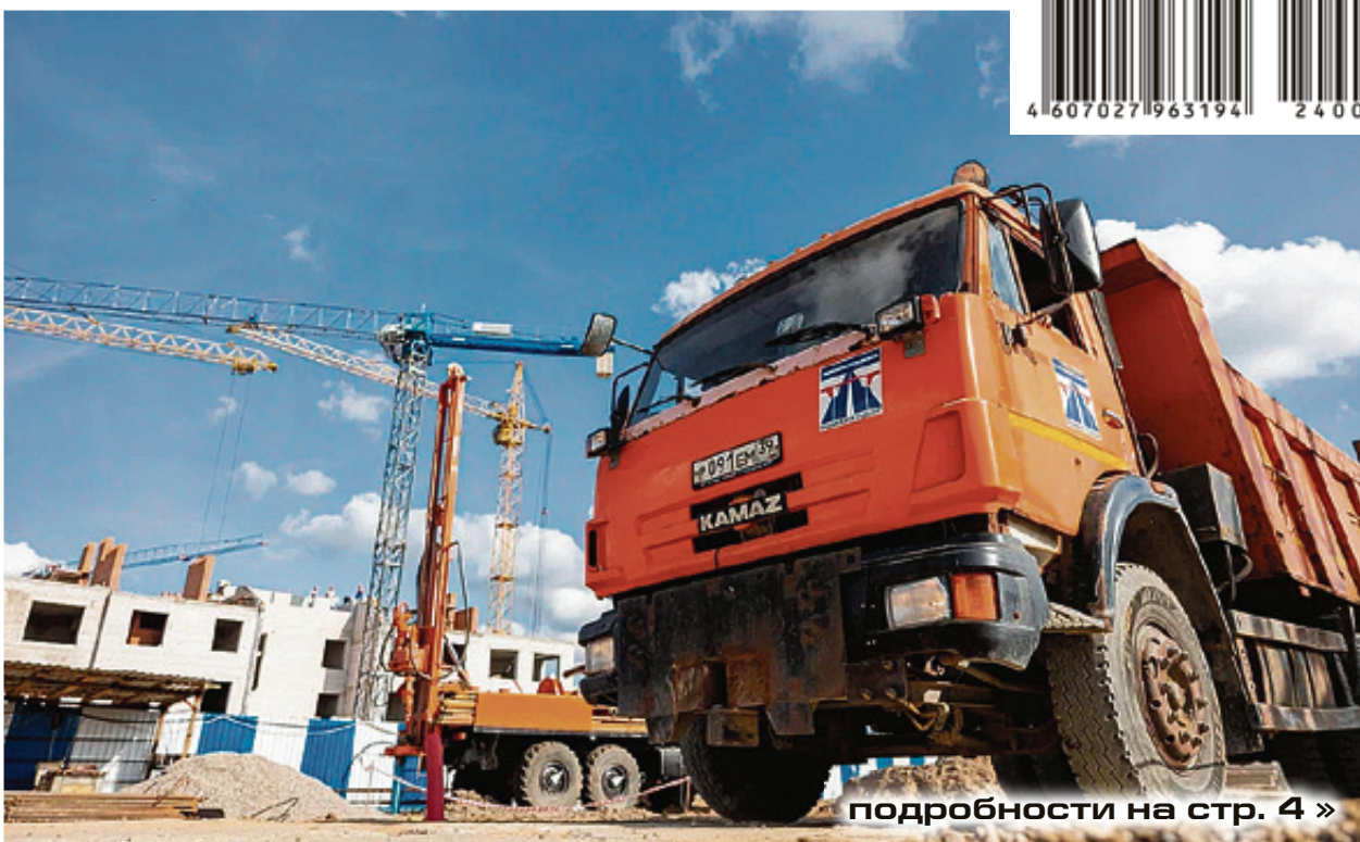
подробности на стр. 4 »