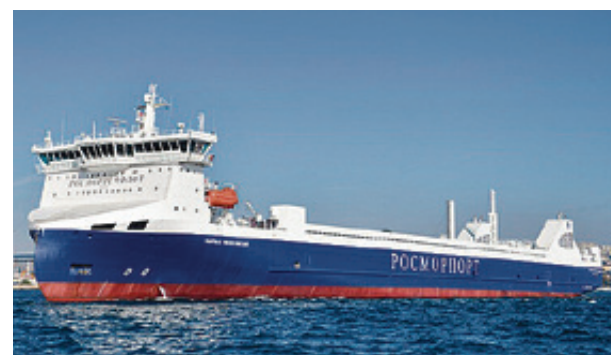
■ Морская линия между Калининградом и Санкт-Петербургом работает стабильно

- Подобного рода действия литовской стороны в одностороннем порядке были совершены в отношении наших таможенных органов. Они также прекратили соблюдать те договоренности, которые были раньше, по контактам и взаимодействию между таможен-