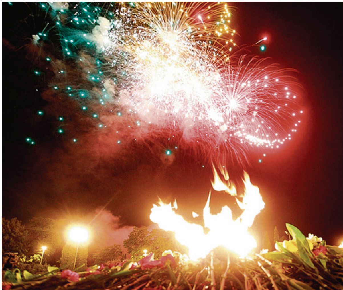
■ Салютные установки разместят за мемориалом 1200 воинам-гвардейцам

Салютные установки разместят за мемориалом 1200 воинам-гвардейцам. Специальное программное обеспечение позволит проектировать и моделировать сценарий салюта. Оператору установки перед началом салюта достаточно лишь нажать кнопку пуска.