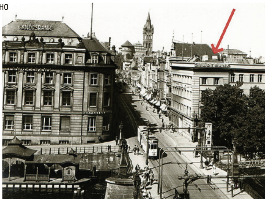
■ Знатоки истории предполагают, что здание находилось рядом с мостом

Пока вход в хранилище закрыли ограждениями.