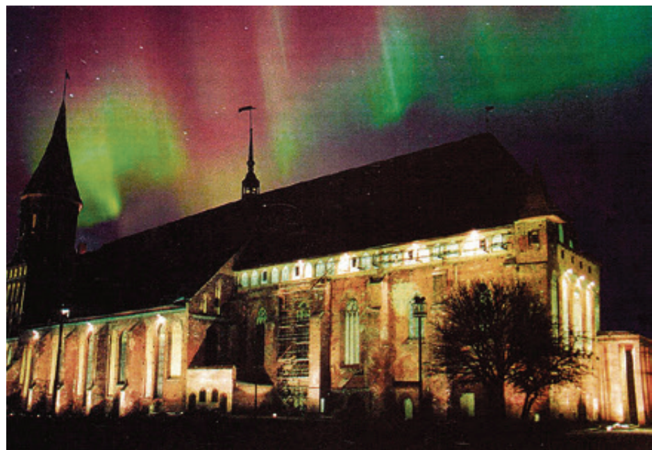
■ Иногда полярные (в народе - северные) сияния случаются и в наших широтах...

В советские времена Калининградскую область местные идеологи с гордостью называли «оплотом научного атеизма». Открыть первый храм здесь разрешили лишь в середине 80-х. В общем, бога нет, религия - опиум для народа, а человек - царь природы. Какие уж тут знамения с неба! Однако когда в январе 1949-го над го-