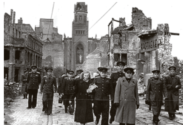
■ Так выглядел центр бывшего Кёнигсберга в 1949 году. На снимке группа экскурсантов в погонах осматривает город в районе нынешней гостиницы «Калининград»

Сталин ответил уже на другой день: «Я благодарен Президенту Трумэну за приглашение в Вашингтон. Приезд в Вашингтон является давнишним моим желанием, о чем я в свое время говорил Президенту Рузвельту