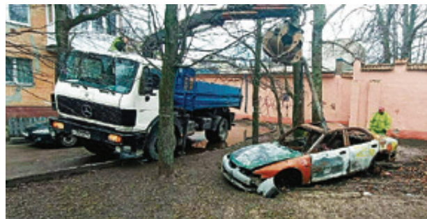
■ Сегодня в реестре «ничейных» машин администрации города значатся 64 автомобиля

Бюджет Калининграда заработал 384 тысячи рублей на утилизации безхозных автомобилей