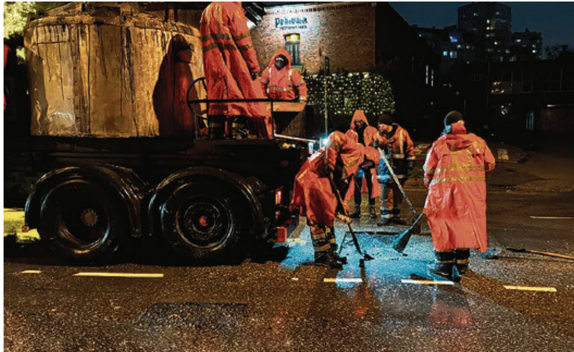
■ Бригада дорожников ликвидирует ямы на проезжей части и в ночное время

января дыры и выбоины заделали уже на 30 улицах в городе. Это Артиллерийская, Куйбышева, Литовский вал, Коммунистическая, Полоцкого и др.