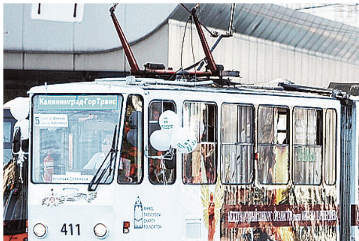
■ «Пятерка» идет по маршруту

- В этом году предстоит продолжение ремонта путей по маршруту № 5 - от улицы Комсомольской до улицы Красной. До этого на Комсомольской и Красной в рамках подготовки к работам проложат съезды для организации реверсивного движения трамваев.