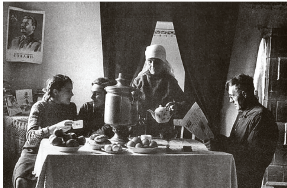
■ Снимок был опубликован в газете, чтобы показать, как хорошо живется переселенцам на новом месте

Что ж, первый вариант смотрится действительно убедительнее второго. Все выглядит совершенно естественно. И воз-