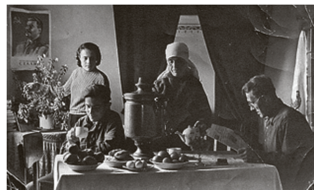
■ А этот вариант остался только в архиве семьи. Как говорится, найдите 10 отличий

Тем не менее героям той фотосессии было дорого и менее фотогеничное «Чаепитие № 2». И хоть за столько лет оно, как видим, порядком истрепалось, его все равно хранили. Как семейную реликвию.