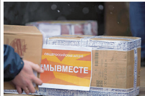
■ Патриотическая акция получила название «Посылка солдату»

Еду и вещи отправят военнослужащим к 23 февраля