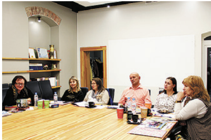
■ Участники «круглого стола» по вопросам развития туризма

По данным системы онлайн поиска авиабилетов Скайсканер, Калининград - одно из направлений, к которому возрос интерес