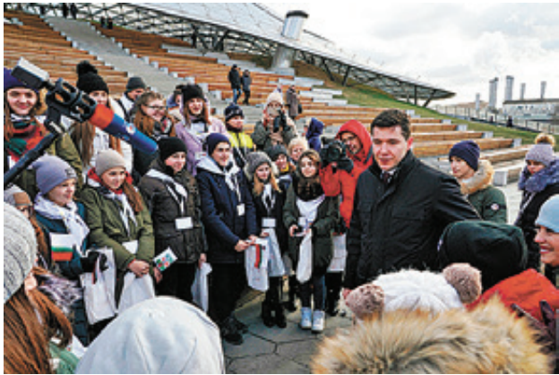
■ Антон Алиханов с калининградскими школьниками посетил парк «Зарядье»