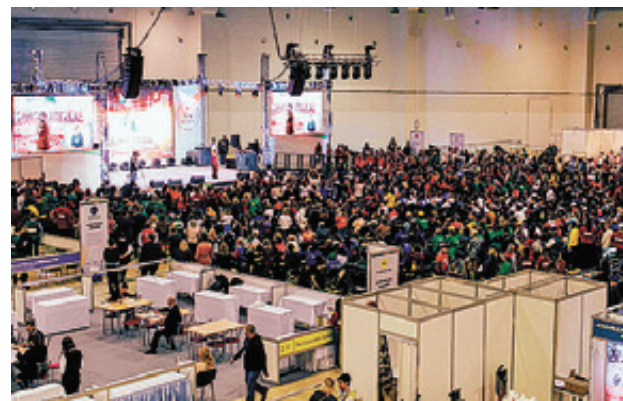
■ В конкурсной программе участвовали представители 83 регионов страны