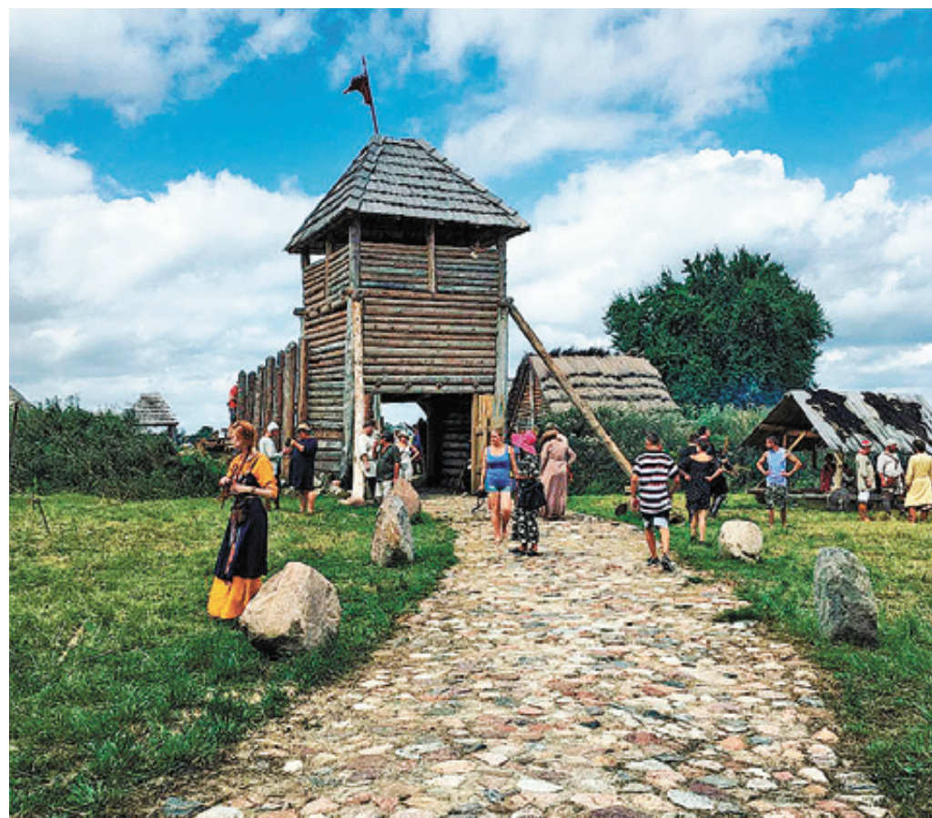
■ Ушкуй - реконструкция укрепленного поселения периода XII-XIV вв.