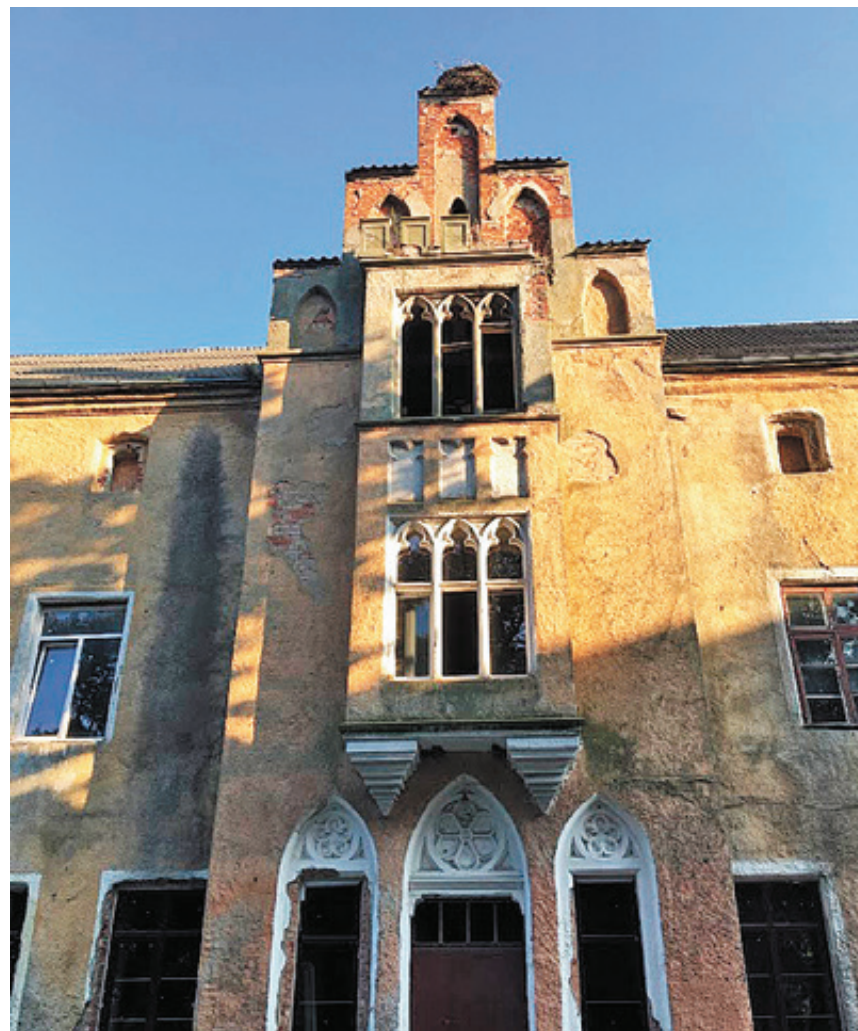
■ В замке Вальдау идут восстановительные работы

Количество мест ограничено, ждем ваши заявки по телефону 52-42-52.