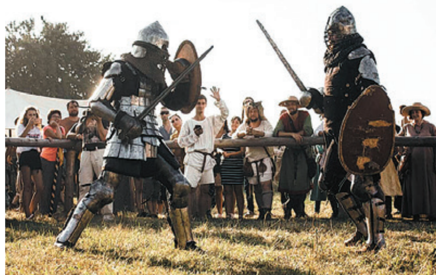
■ Рыцарские бои понравятся и взрослым, и детям