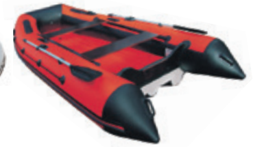
Лодка «Риф» HD «Тритон»