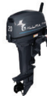
Мотор ALLFA CG T20