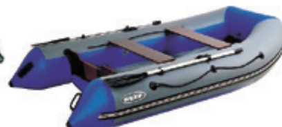
Лодки «Риф» HD