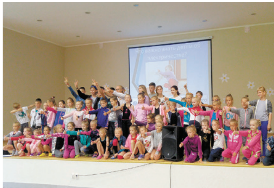
Фотографии предоставлены лагерем «Паруса надежды»