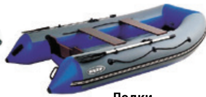
Лодки «Риф» HD