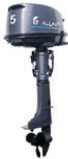
Мотор ALLFA CG T5