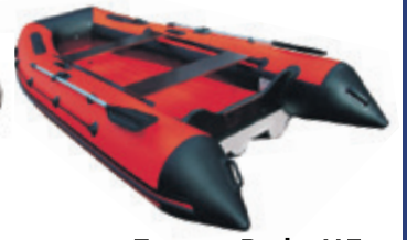
Лодка «Риф» HD «Тритон»