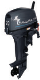
Мотор ALLFA CG T20