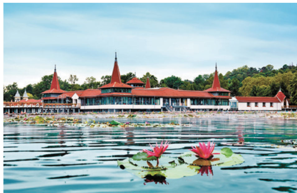
■ Озеро Хевиз славится своими целебными свойствами