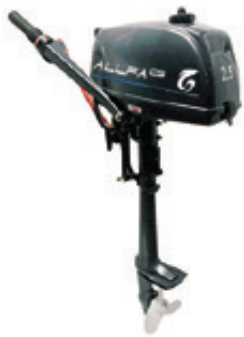
Мотор ALLFA CG T2,5