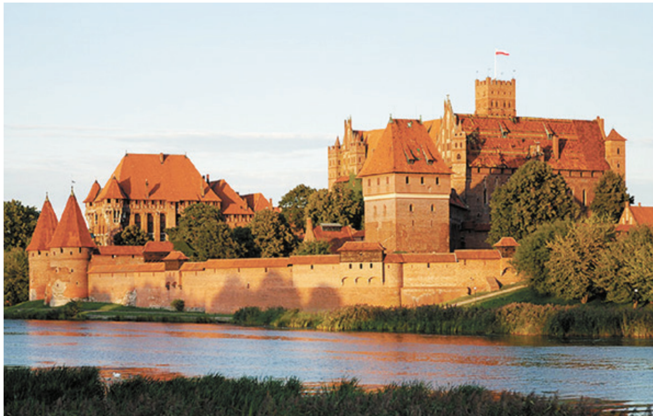
■ Замок в Мальборке - жемчужина северной Польши

Автобусные туры для тех, кто ценит комфорт и любит яркие впечатления