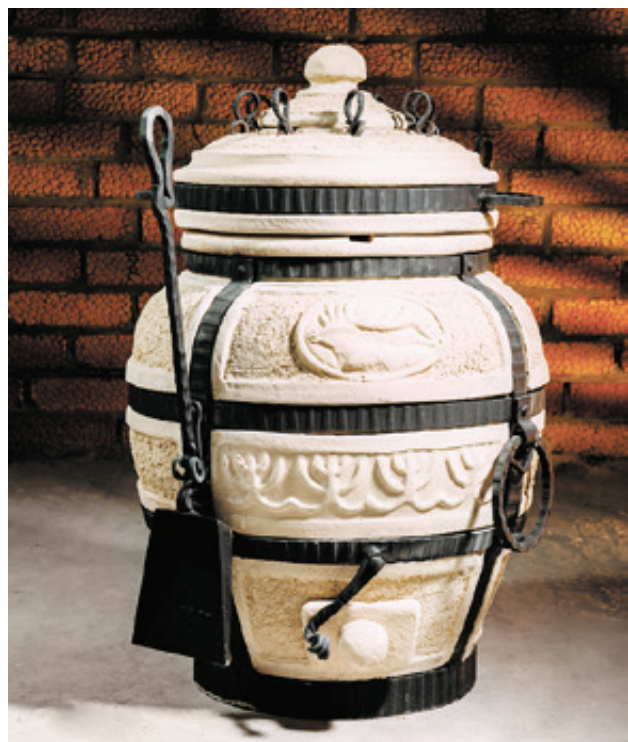
Подготовила Ирина Белкина

С наступлением весны многие хозяева дачных и приусадебных участков задумываются над тем, как порадовать своих домочадцев и гостей вкусными горячими блюдами, приготовленными вне дома. Толковые советы можно получить в магазине «Камин Илья», который уже не первый год работает на этом рынке, обеспечивая калининградцев всеми необходимыми приспособлениями