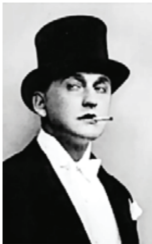
■ Александр Вертинский - кумир эстрады XX века