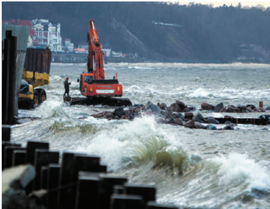
■ Областные власти решили защитить светлогорский пляж с помощью бун

Губернатор Антон Алиханов сообщил, что в Светлогорске будут продолже-