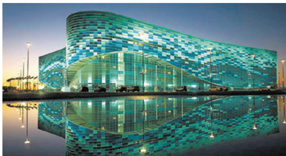
■ Дворец зимнего спорта «Айсберг» вмещает 12000 зрителей