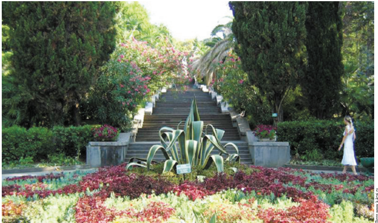
■ Сочинский дендрарий - зеленая сокровищница российских субтропиков