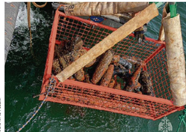
■ С затонувшей немецкой баржи извлекают снаряды сотнями

Напомним, немецкая баржа затонула в 1945 году. Впервые опасность судна российские специалисты оценили в 2010 году, с того момента разминирование проводится планомерно.