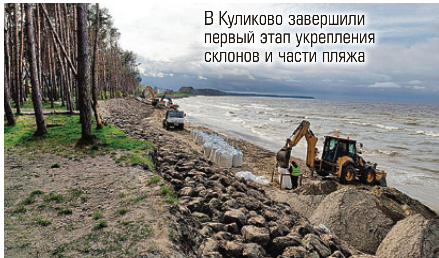
■ Сейчас укрепляют берег там, где штормило больше всего

В Куликово завершили первый этап укрепления склонов и части пляжа