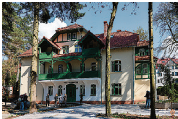
■ В довоенный период здесь располагался частный пансионат, в советское время - один из корпусов санатория

Отель построен при поддержке областного правительства