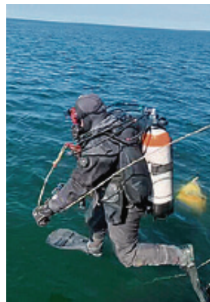
■ Водолазы работают четко