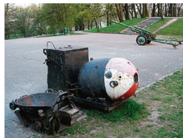
■ Остальные экспонаты тоже подверглись атаке. Но они оказались лучше закреплены