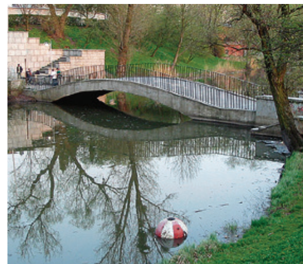
■ Мина катилась не в пример легче. И в итоге оказалась в пруду, закачавшись на воде рядом с мостиком, ведущим к мемориалу 1200 гвардейцам