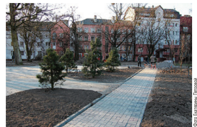
■ В Генплан города обещают добавить 100 гектаров под зеленые зоны

- ул. Украинская. Также на встрече активисты предложили включить в список зеленые зоны микрорайона пос. А. Космодемьянского, ул. Карамельной — Балтийского шоссе, ул. Горной и пр. Победы (ул. Дм. Донского), Московского пр-та (вдоль набережной Новой Преголи), ул. Чайковского,