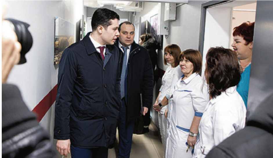
■ Во время выезда Антон Алиханов побывал в двух медицинских учреждениях

Антон Алиханов побывал также в отделении гериатрии, созданном в октябре этого года по региональному проекту «Старшее поколение» в рамках нацпроекта «Демография». Здесь отремонтирован первый этаж. Во всех палатах установлены многофункциональные кровати и раковины, оборудована комната для сотрудников, кабинет медицинского психолога, созданы палаты повышенной комфортности. В ходе ремонтных работ на первом этаже полностью заменена электропроводка, обновлена система водоснабжения. Благоустроена и прилегающая территория: оборудованы